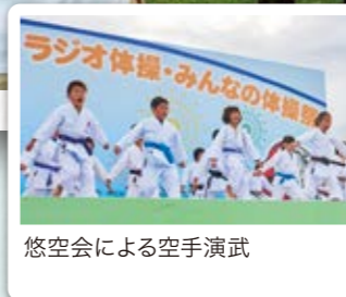
悠空会による空手演武