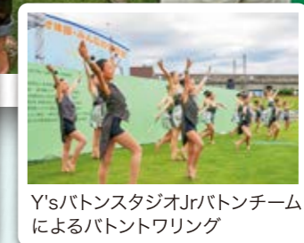
Y'sバトンスタジオJrバトンチームによるバトントワリング