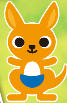
かんぼ生命 企業キャラクター かんぼくん

6月11日(日)、アオーレ長岡で「第48回子どもフェスティバル」が開催されました。