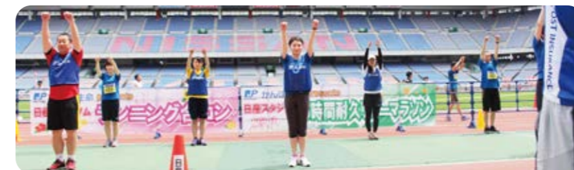
ランニングイベントでラジオ体操に励む二人(後列 両端)。

一しよう計画していましたが、自分ではできていると思っている動きがまったく違っていたり、受講するたびに新たな発見があったりと、ラジオ体操の奥深さを痛感しています。自分の健康にとっても有意義な経験となっているので、しっかり習得して、試験に合格できるよう頑張ります。