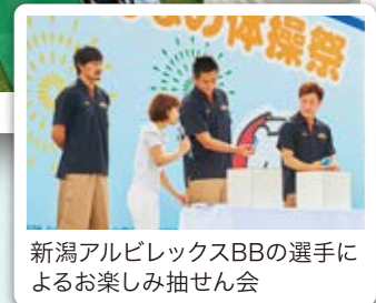
新潟アルビレックスBBの選手によるお楽しみ抽せん会